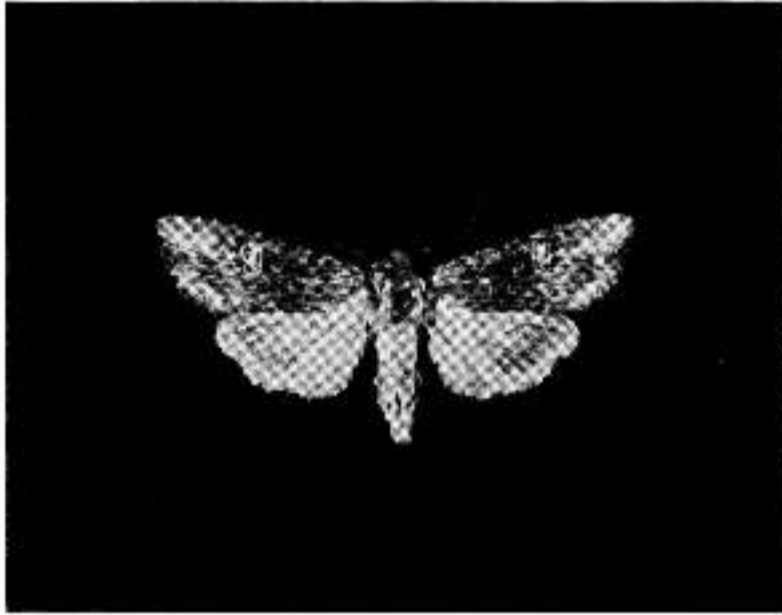
Fig. 1. Lithomoia solidaginis (Hb.)—♀, Soțca, 1.IX.1981 (leg. Wl. Manoliu).